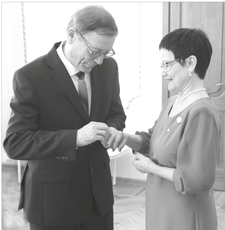
Супруги вновь обменялись обручальными кольцами