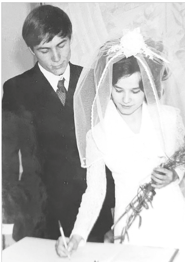
Студенческая свадьба в 1974 году