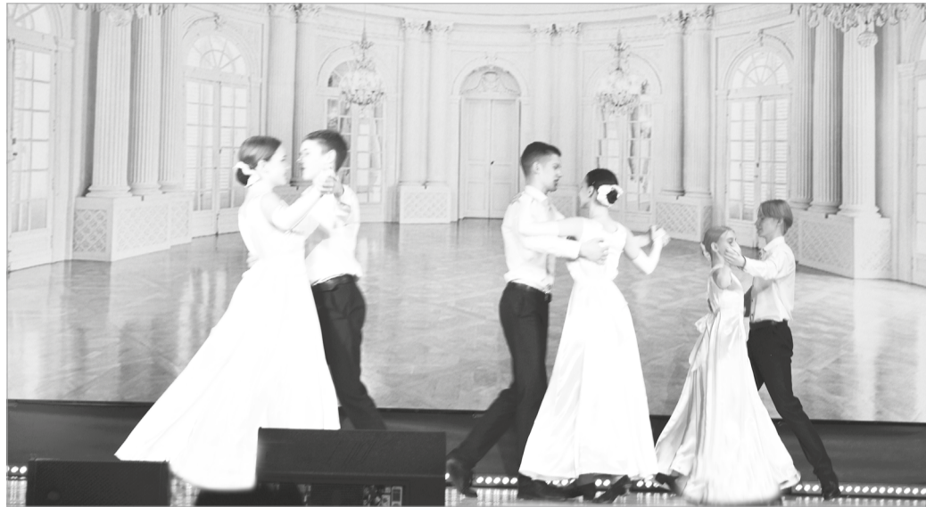
«Русский вальс» очаровал всех: и детей, и взрослых