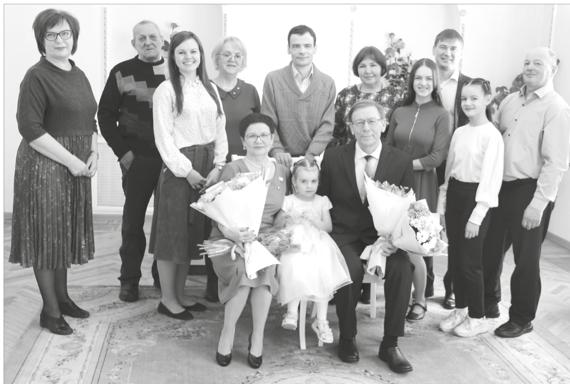
Виновников торжества поздравили родные и близкие